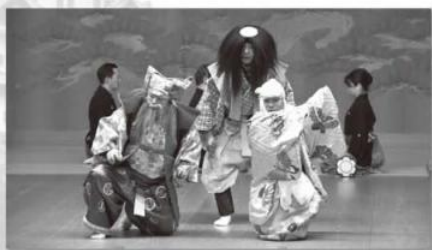
なごや妖怪狂言「冥加さらえ」