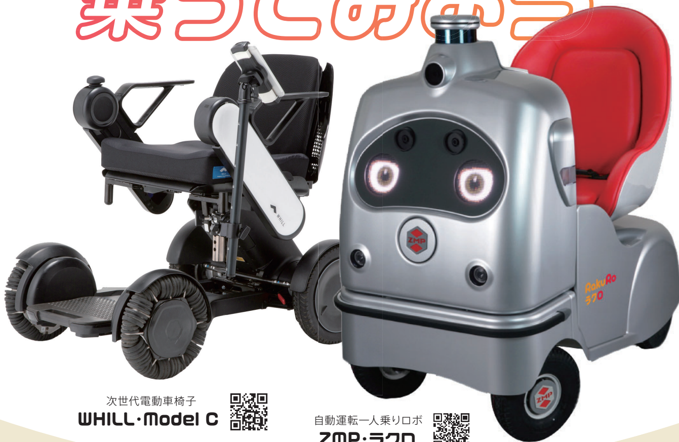
次世代電動車椅子 WHILL・Model C