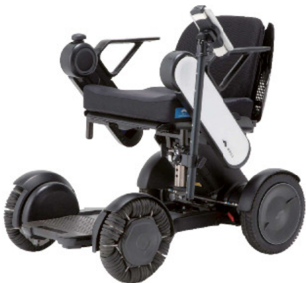
近距離モビリティ WHILL Model C

体験① 次世代モビリティを活用した自由散歩、 観光・ルート案内アプリ体験【事前予約】