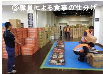
③ 職員による食事の仕分け