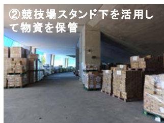
② 競技場スタンド下を活用して物資を保管