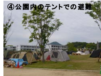
④ 公園内のテントでの避難