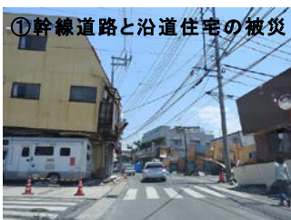
① 幹線道路と沿道住宅の被災