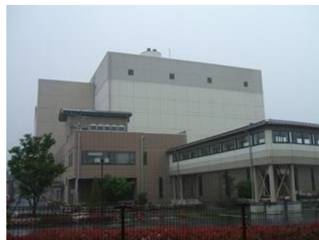
エネルギー回収推進施設